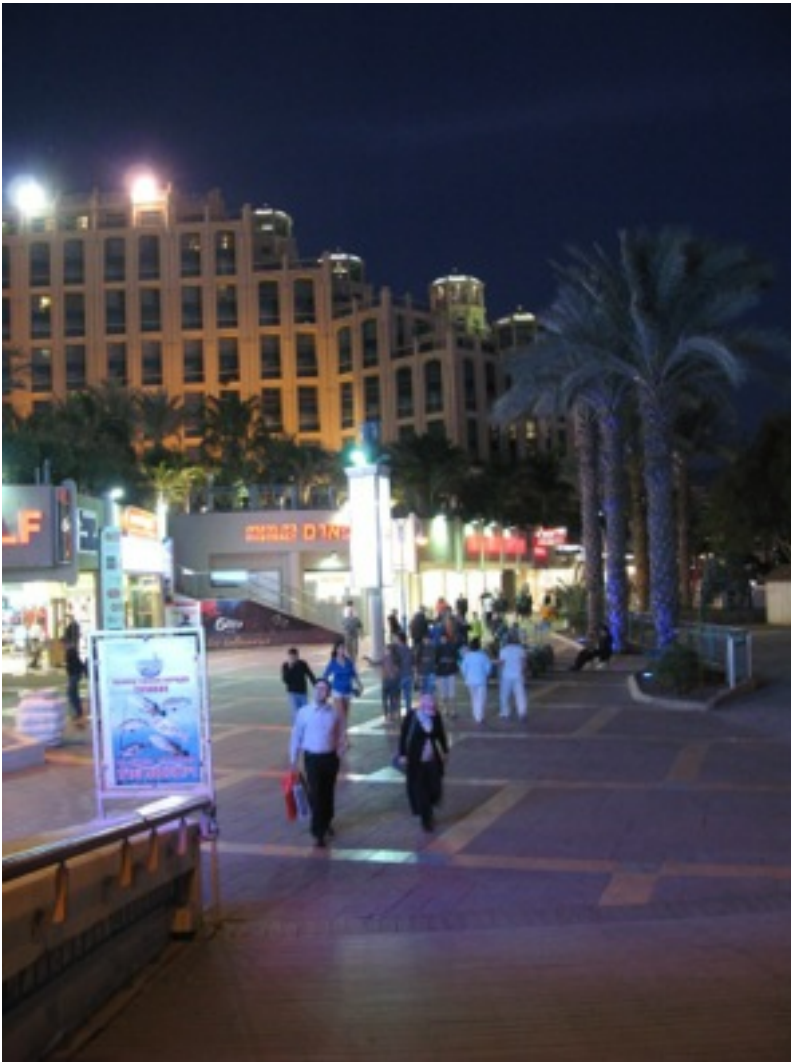
21.1. på vej til lufthavnen.